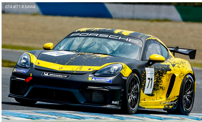
GT4 #71 R.SAWA