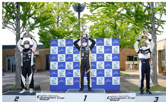
GT3-I Class Podium