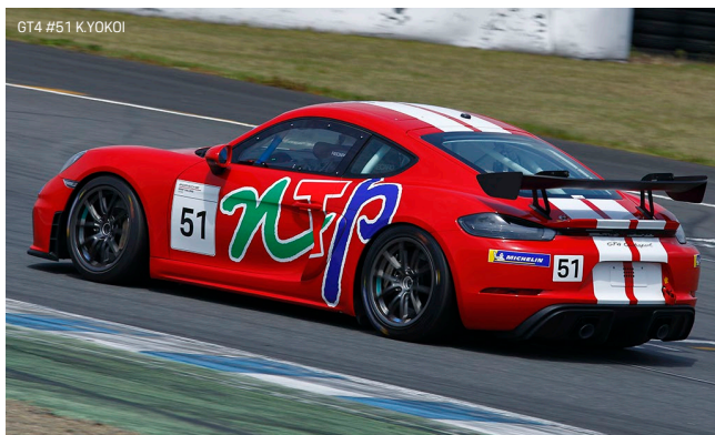
GT4 #51 K.YOKOI