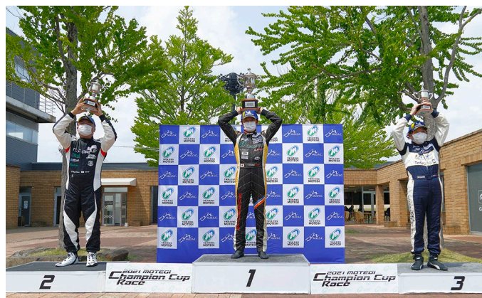
GT3-I Class Podium