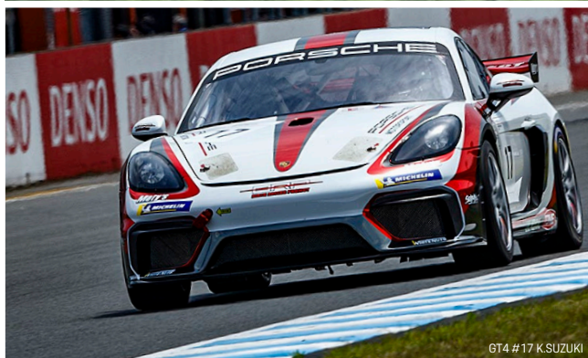
GT4 #17 K.SUZUKI